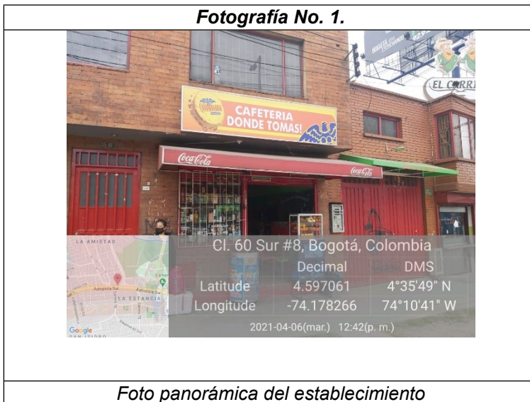
Foto panorámica del establecimiento