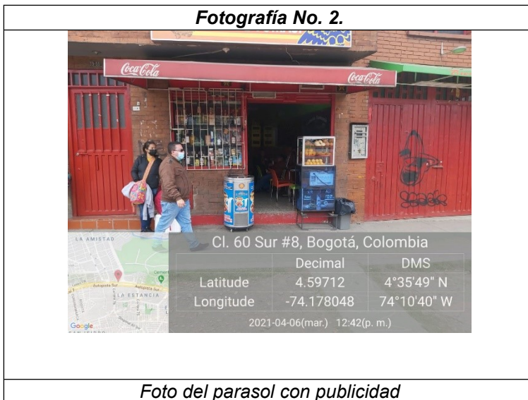
Foto del parasol con publicidad